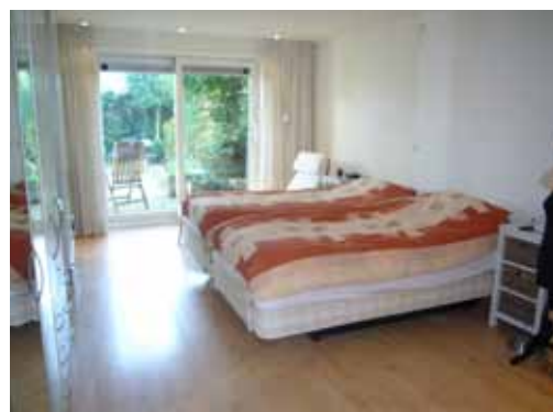
Woonkamer keuken en slaapkamer voor Feng shui