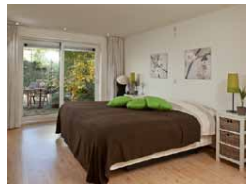
Woonkamer keuken en slaapkamer na Feng shui

invloeden opheffen of verminderen. Makelaars en stylisten letten daar niet op, terwijl die omgevingsfactoren juist zo belangrijk zijn voor de verkoop van een huis."